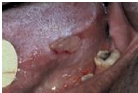
Fig. 3. Ulcération traumatique.

Il convient d'évoquer une pathomimie devant une ulcération sans étiologie évidente chez un patient en difficulté psychologique.