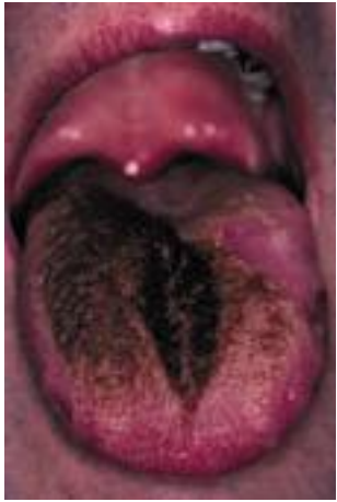
Fig. 10. Langue noire villeuse.

– Ce trouble est asymptomatique ; il a pour seule conséquence un préjudice esthétique avec sa composante psychologique.