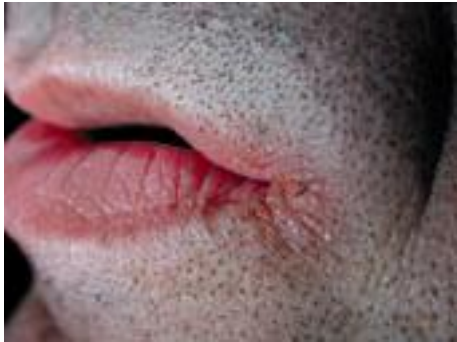
Fig. 8. Perlèche.

desquamatif ou croûteux et parfois débord sur la peau adjacente. Elle est souvent entretenue par un tic de léchage.