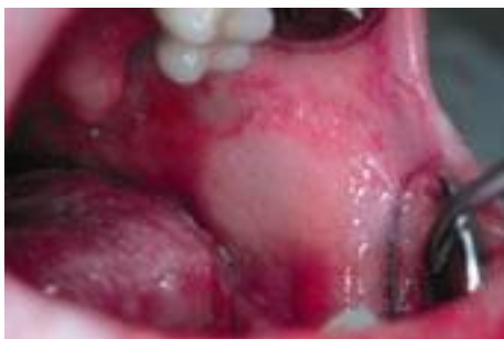
Fig. 6. Stomatite érythémateuse à Candida .

Phase de début : elle dure 2 à 3 jours et réalise une stomatite érythémateuse diffuse (Fig. 6) : sensation de sécheresse buccale, de douleurs à type de cuisson, de goût métallique et de gêne à la mastication. Des troubles de la succion sont observés chez le nouveau-né. À l'examen, la muqueuse apparaît desséchée, rouge, douloureuse. La langue est plus ou moins dépapillée. L'érythème touche la face dorsale de la langue, la voûte du palais et les faces internes des joues (macules coalescentes).