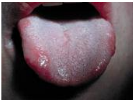
Fig. 1. Aphte banal.