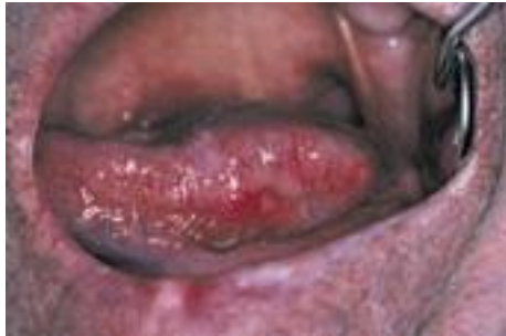
Fig. 4. Carcinome épidermoïde lingual.

La lésion saigne au contact et peut survenir sur un terrain particulier (lésion précancéreuse leucoplasique ou lichen ancien), avec influence de cofacteurs (tabac, alcool, mauvaise hygiène buccodentaire).