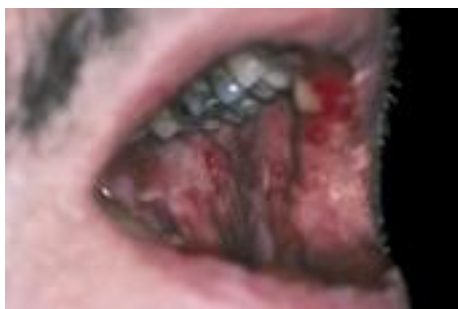
Fig. 5. Érythème polymorphe.

Dans le syndrome de Stevens-Johnson, les croûtes labiales et cutanées sont hémorragiques. L'atteinte oculaire peut entraîner la cécité ; l'atteinte pulmonaire ou rénale est mortelle dans 10% des cas.