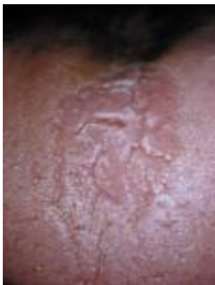
Fig. 9. Glossite losangique médiane.

Elle siège en avant du V lingual sous forme d'une zone médiane décapillée, rouge carminée, plus ou moins indurée en superficie (Fig. 9). La lésion est légèrement surélevée, mamelonnée, mais parfois elle est un peu déprimée. La forme est grossièrement losangique ou ovale.