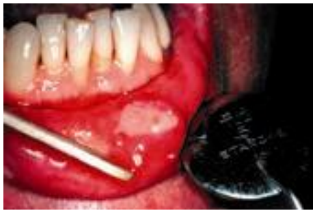
Fig. 2. Aphte géant.